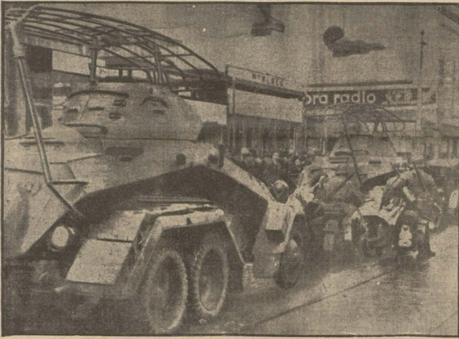
Alman motörlü kıtaarı Prag caddelerinden geçerken

Dün İngiliz ve Fransız kabineleri fevkalâde birer toplantı yaptılar Çemberlayn bugün beyanatta bulunuyor Alman sefiri Londrayı terketti