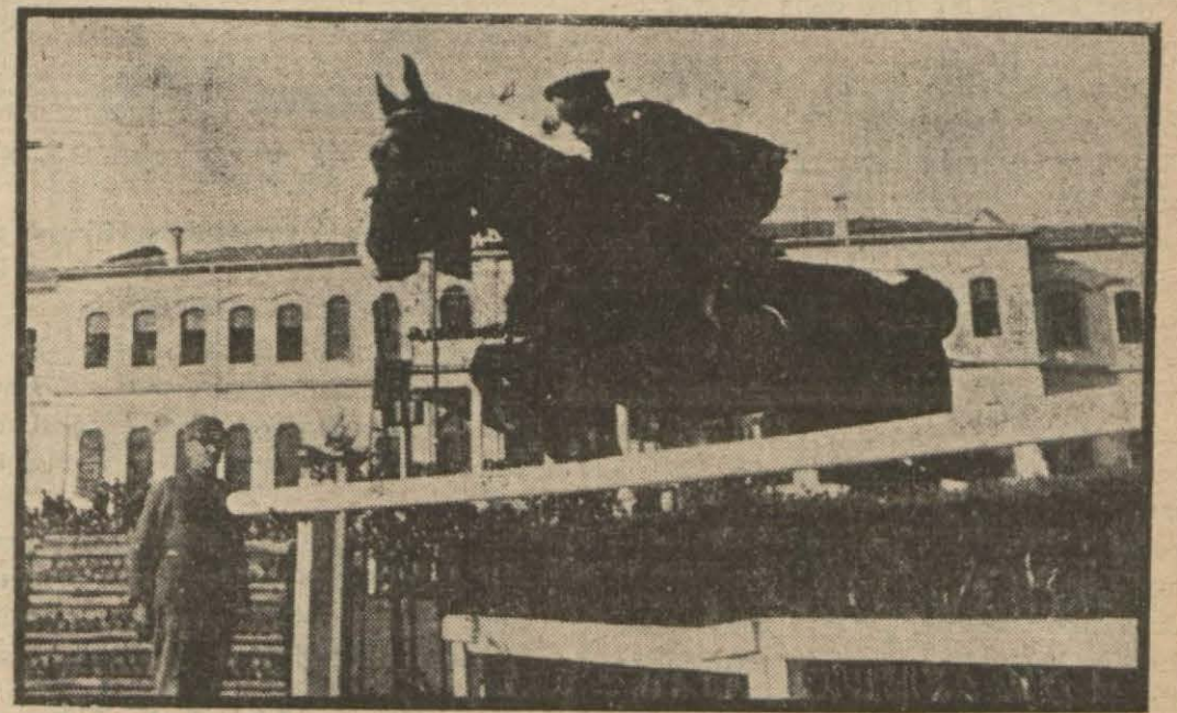
Atlı müsabakalarda bir süvarimiz mania atlarken (Yazısı 8 incide)